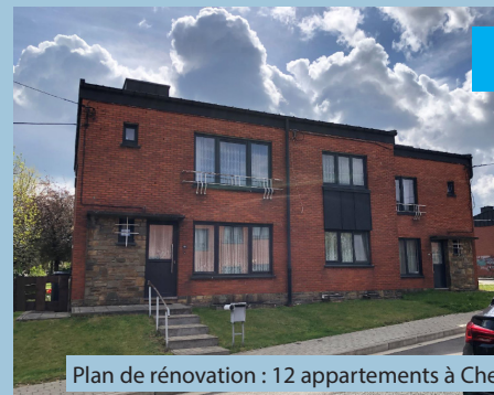
Plan de rénovation : 12 appartements à Cheratte-Haut (voir page 2)